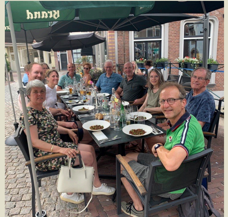
Bestuur en kerngroep, juli 2023